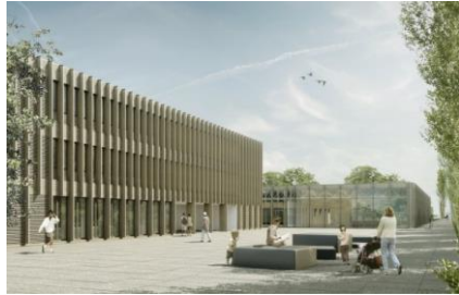
Gymnasium Biel-Seeland Gymnase de Bienne et du jura bernois

Gymnasium Biel-Seeland, Fachmittelschule FMS, Wirtschaftsmittelschule WMS Gymnase français, école supérieure de commerce ESC, Ecole de Culture Générale ECG