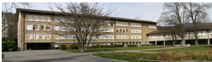
Oberstufen- zentrum Rittermatte

Fussball (Herren), Eishockey, Sportklettern, Tennis, Volleyball