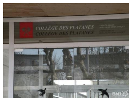
Collège des Platanes

Frauen Fussball national, Judo, Karate, Kunstturnen, RG, Leichtathletik, Musik, Tanz