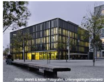
Bildung Formation Biel-Bienne; BFB

Gymnasium Biel-Seeland, Fachmittelschule FMS, Wirtschaftsmittelschule WMS Gymnase français, école supérieure de commerce ESC, Ecole de Culture Générale ECG