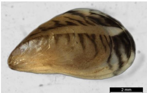
Abb. 1: Quagga-Muschel.

Sie kann eine Größe von bis zu 40 mm erreichen und wird etwa drei bis fünf Jahre alt. Das Alter eines Individuums lässt sich mithilfe von Altersringen bestimmen. Anhand der Größe ist dies nicht zuverlässig möglich. Das größte Wachstum wird im Frühjahr erreicht und ist abhängig von der Wassertemperatur, der Nahrungsverfügbarkeit, den Sauerstoffverhältnissen und der Strömung.