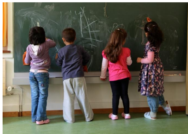
"Die Kindergartenzuteilung läuft"

konferenzen mit allen betroffenen Lehrpersonen sowie an den Schulleitersitzungen besprochen.