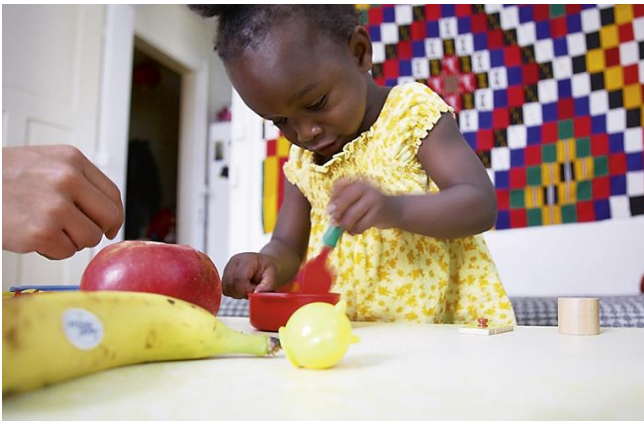
"Freie Plätze an den Mittagstischen"

Wegen krankheitsbedingten Langzeitausfällen und einem Baby-Boom beim Tagesschulpersonal müssen viele Stellvertretungen gesucht werden. Eine Entlastung ergibt sich durch drei neue Springerinnen, die im Februar ihre Arbeit aufnehmen. Sie können auch kurzfristige Arbeitsausfälle auffangen.