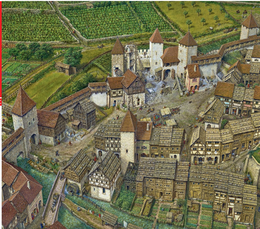
Ansicht von Biel um 1500, Gegend um das alte Schloss, zwischen dem Pasquarttor und dem Kirchgässli, nach einer Darstellung von Jörg Müller Aperçu de Bienne vers 1500 aux environs de l'ancien château, entre la porte du Pasquart et la ruelle de l'Eglise, selon une représentation de Jörg Müller

Le Conseil municipal veut renforcer la qualité de vie et d'habitat à Bienne. Pour ce faire, il a lancé une campagne intitulée «ENGAGEMENT!». > p. 4