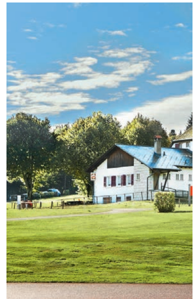
Abb. 3: Das Restaurant «Ende der Welt» wird ab Frühjahr 2014 wieder für Spaziergängerinnen und Spaziergänger geöffnet sein Img. 3: Le restaurant de la Fin du Monde ouvrira ses portes aux promeneurs au printemps prochain