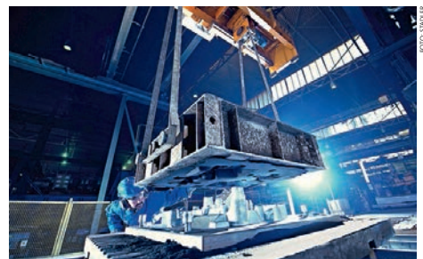
Abb. 4: Die Firma Stadler Stahlguss AG hat Luftschutzmassnahmen ergriffen Img. 4: L'entreprise Stadler Stahlguss AG a pris des mesures de protection de l'air