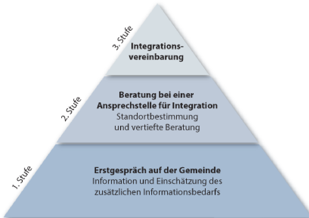
Berner Modell der Integration gemäss IntG, Art. 6-9